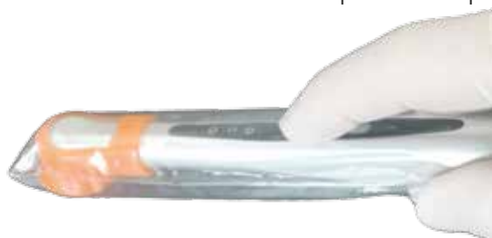
Protection jetable intégrale [ULTI-G500]

Les protections intégrales à usage unique empêchent la contamination croisée et évitent l'adhésion de composite ou résine dentaire à la surface de la lentille et du corps de la lampe.