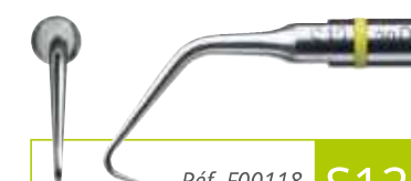
Réf. F00118 S12-70D

Insert a retro orienté à 70°, diamanté 30 µm, longueur 5 mm, conicité 9%