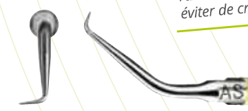
Réf. F00080 ASLD

Le kit Apical Surgery, avec son concept unique 3-6-9 mm, permet un traitement d'endodontie rétrograde contrôlé et plus économe en tissu osseux et dentaire.