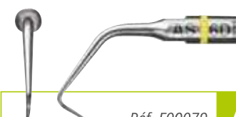
Réf. F00079 AS6D

Insert diamanté 30 µm, longueur 6 mm, conicité 9%