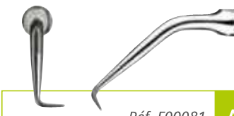
Réf. F00081 ASRD

L'insert AS9D doit d'abord être introduit à l'intérieur de la cavité et orienté selon l'axe de la racine avant d'être activé pour éviter de créer une «fausse route».