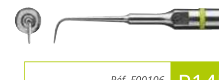
Réf. F00106 P14D

Insert a retro universel diamanté 30 µm, longueur 5 mm, conicité 7%