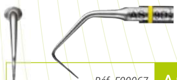
Réf. F00067 AS9D

Insert diamanté 30 µm, longueur 9 mm, conicité 8%